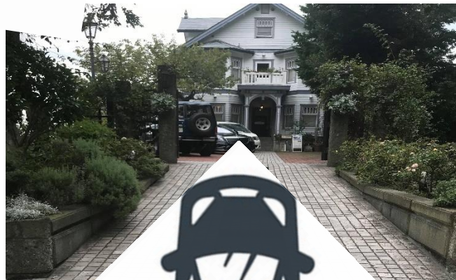
正面からお入りください