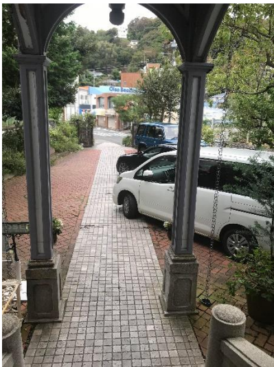
建物から見た状態